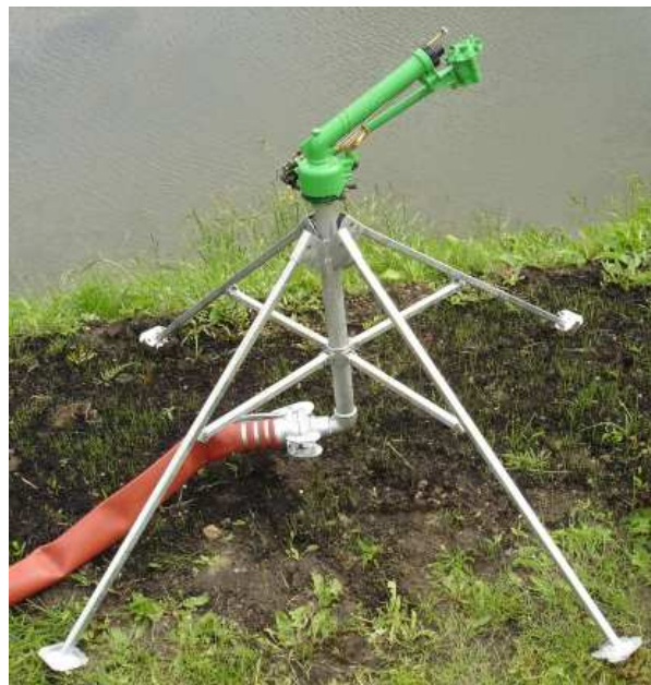
Skipper promień zraszania 35m, 6 ustawień

W skład zestawu do nawadniania boiska wchodzi zraszacz turbinowy SKIPPER, podstawa czteronożna, trzy odcinki węża flat 3" po 20 mb, 2 deszczomierze szklankowe. Dopełnieniem zestawu może być wózek węzowy. Zestaw taki będzie wystarczający pod warunkiem że w bezpośrednim sąsiedztwie boiska, po przeciwległych stronach będą dwa hydranty w podziemnych studzienkach zasilane rurociągiem minimum PE90 o wydajności 600 l/min przy ciśnieniu minimum 3,5 bar. Nawadnianie boiska rozpoczynamy od ustawienia zraszacza na stanowisku środkowym i ustawieniu sektora pracy na pełny obrót. Po 1 - 2 godzinach pracy uzyskujemy dawkę polewową 8-16 mm wystarczającą na 2-4 dni. Na stanowiskach bocznych czas pracy zmniejszamy o połowę a na stanowiskach narożnych cztery razy krótszy niż na pierwszym. Dla uzyskania równomiernej dawki polewowej na całej powierzchni korzystamy z okresowego rozpraszacza strumienia.